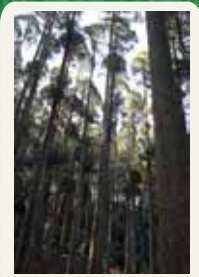
百年の森 樹齢 100 年にもなる南郷 檜やメアサ杉の人工林。