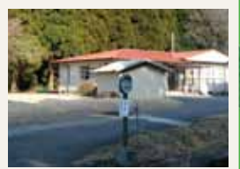
東竹原老人憩の家