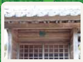
野原天満宮の鯉口 町指定文化財。鯉口をならすと向 う側に聖域が広がる。