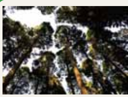
五十年の森 全国に知られる「南郷檜」など、 樹齢 50 年前後の森林です。